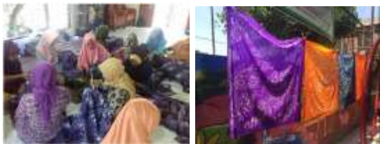
Gambar 3 Pelatihan Kegiatan Membatik Warga

Keterampilan Masyarakat Tidak Mampu Kelurahan Meteseh memiliki sentra Pendidikan Keterampilan yaitu Kelompok Batik Meteseh (KBM) yang telah mempunyai kepengurusan dan anggota. Selama ini hasil produksi Kelompok Batik Meteseh (KBM) bergantung dari pesanan pihak Sanggar Batik Semarang-16 dan Batik Seroja. Hal tersebut dikarenakan kurangnya ketersediaan alat, pemasaran serta ide pembuatan motif. Perangkat Kelurahan Meteseh sangat mendukung penuh dalam proses perkembangannya dibuktikan dengan diadakannya sosialisasi dan pelatihan-pelatihan yang telah dilakukan oleh pihak kelurahan.